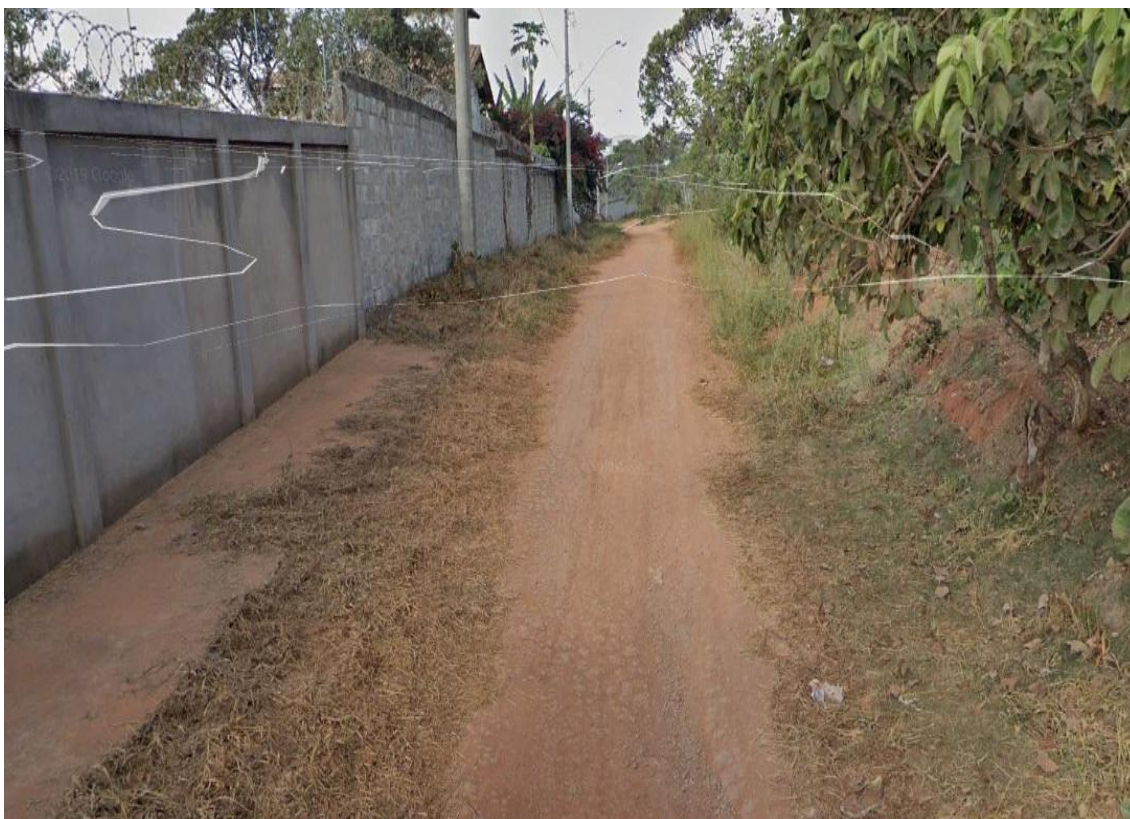
Foto 4 - Rua Vereador Eliseu Alves da Silva