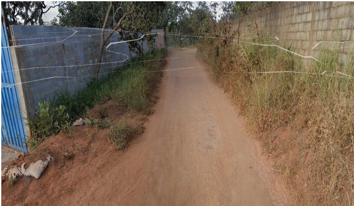
Foto 1 - Rua Ladumila de Abreu

OBJETO: Contratação de empresa de Engenharia para a realização da obra de: PAVIMENTAÇÃO RUA VEREADOR MANOEL SOARES DOS SANTOS, RUA TENENTE AURÉLIO SAMPAIO, LADUMILA DE ABREU, VEREADOR ELIZEU ALVES DA SILVA, VEREADOR JOSÉ ÂNGELO DE OLIVEIRA, VEREADOR ANTÔNIO DE PAULA ALVES E RECAPEAMENTO RUA VEREADOR JOSÉ ANGELO OLIVEIRA, com fornecimento de materiais, equipamentos necessários e mão de obra, conforme relação constante deste projeto básico, com fornecimento de materiais, equipamentos necessários e mão de obra.