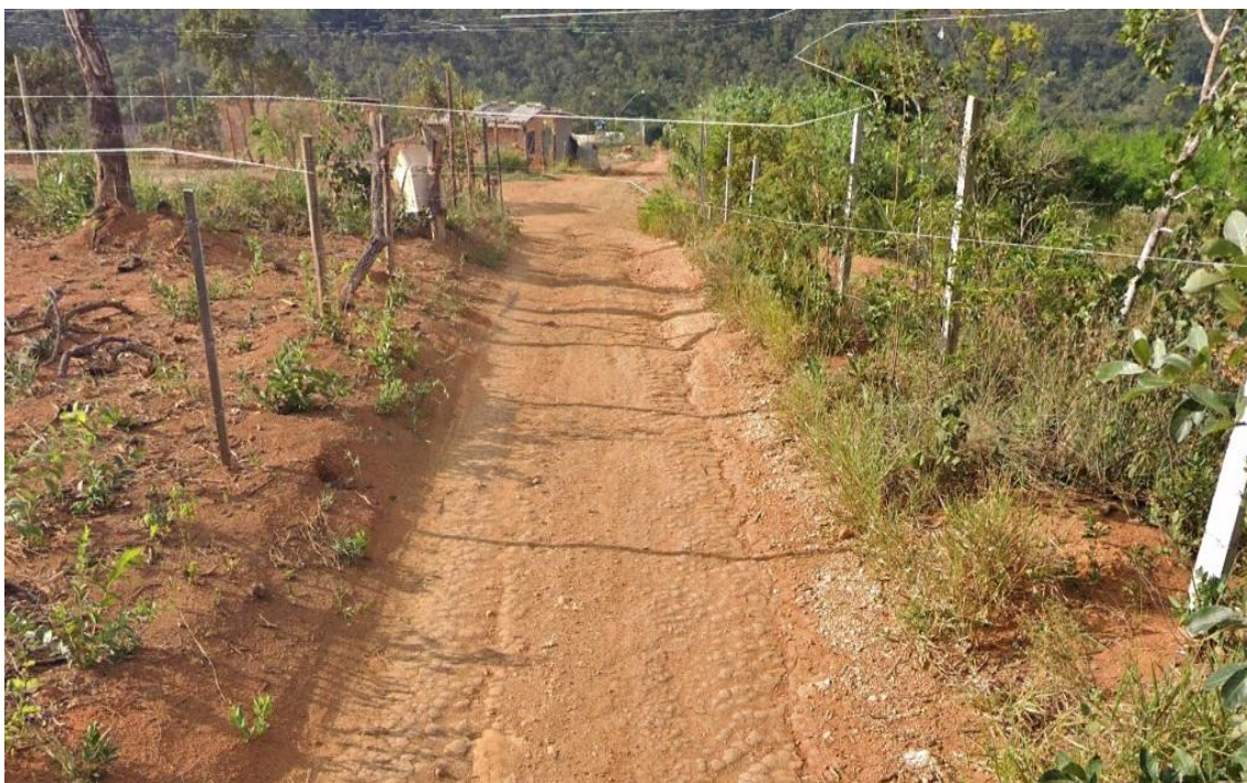
Foto 3 - Rua Vereador Antônio de Paula Alves